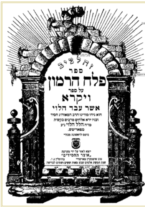
שער ספרו הנודע של הרה"ק רבי הלל מפאריטש זי"ע, 'פלח הרמון'

בשיחת שבת חזון תש"מ (הופיעה בלקוטי שיחות חלק כ"ט פרשת דברים), שאל הרבי את הקושיא הידועה של רבי חיים פאלאגי: הכיצד היה מותר לו להקב"ה לשלוח את מלכות בבל ורומי להחריב את בית המקדש, והרי יש איסור לנתן בית אלוקינן, כמו שכתוב "לא תעשון כן לה' אלקיכם",