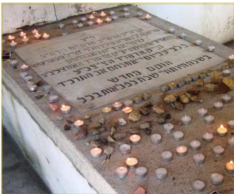
מצבת קבורו של הרה"ק רבי הלל מפאריטש זי"ע בעיר חרטון

אבל הנשמה שלך כבר קלטה שיעור חדש מאת הקב"ה לחיים. אז מה היא עושה? היא מסתלקת מהשיעור הישן. פתאום הכל לא עובד. הבית נהרס. לכאורה אין כלום. כל ההרגלים הישנים שעבדו בבית כבר לא