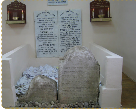
אוהל כ"ק אדמו"ר הצמח צדק וכ"ק אדמו"ר מהר"ש בליובאוויטש