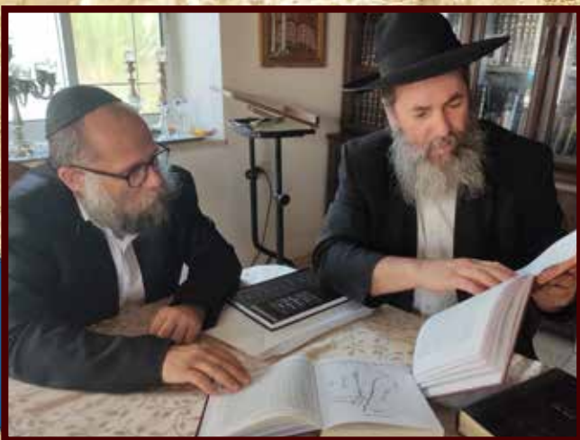
בשיחה מעמיקה במעון מציג הרב בלוי ל'כי קרוב' את דברי הפוסקים השונים אודות מקום הגבול המדויק

ונהרא נהרא ופשטיה וכל אחד יעשה כדעת רבותיו והאמת והשלום אהבו. ונוכה תכף ומיד שיעמוד כהן לאורים ותומים בבית המקדש השלישי בגאולה האמיתית והשלמה על ידי משיח צדקנו בקרוב ממש.