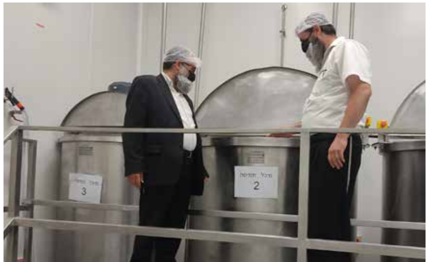
בתוככי המפעל המייצר יטמינים כשרים למהדרין בהשגחת בד"צ העדה החרדית

פיו של האיש מלא תודה והוקרה לרב. יש לו כבר ציפייה לשיעור הבא בו ייטול חלק. גם מתכונת השיעורים פה אינדיבידואלית. יש שיעורים קבועים בבית הכנסת הגדול ביישוב ספיר, בו מתגורר הרב, אך יש גם שיעורים פרטיים, אחד על אחד, בכל מקצועות התורה. עוד שיעור ועוד שיעור, עוד קביעות ועוד חברותא. וכך נפתחים הלבבות, יהודים מתקרבים אל בוראם, נשמות שבות, כל אחת בקצב