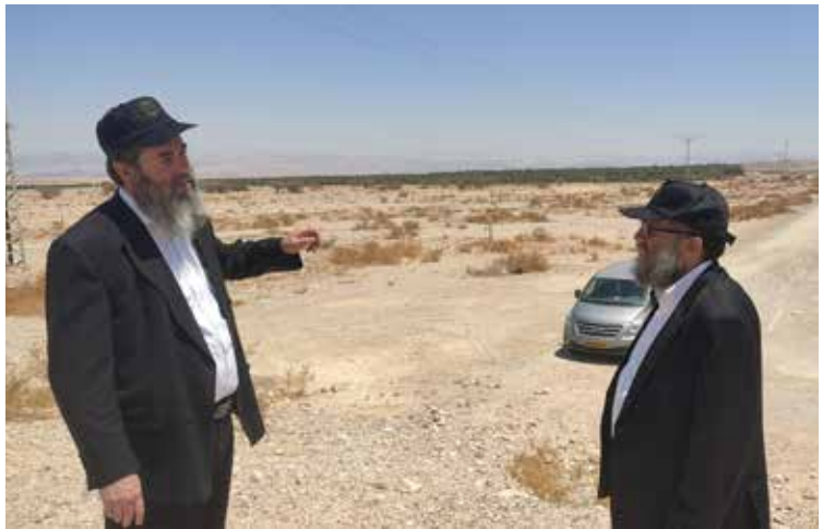
דיון על גבולות הארץ תחת החמה הקופחת בלב הערבה התיכונה

יששום מדבר וציה ותגל ערבה ותפרח פחבצלת (ישעיה לז, א). ■