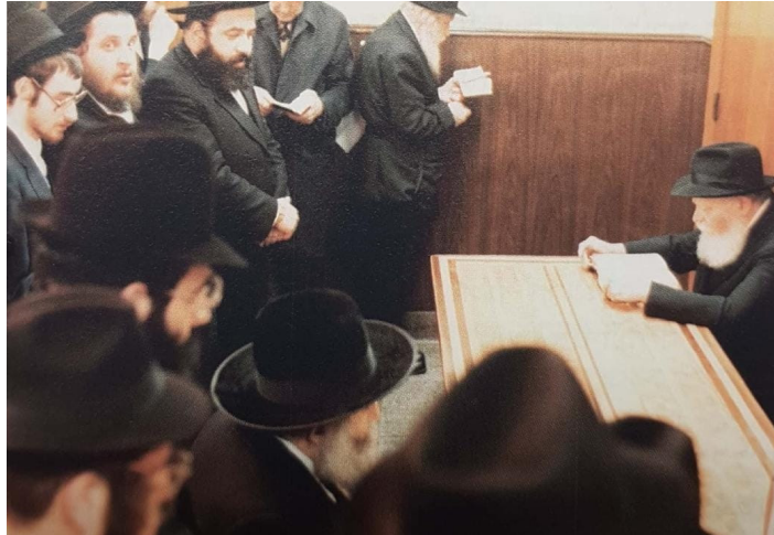
ביקור הרפ"מ ד' אייר תשמ"ג

ולכן ה' כ"ק מו"ח אדמו"ר חוזר ומדגיש שאע"פ שנתנית הצדקה צריכה להיות באופן שנותן מעצמו בסבר פנים יפות כו', ובפועל רואים לפעמים שצריכים לדבר עם פלוני (לא רק פעם אחת, אלא) כמה פעמים כדי לפעול עליו שיתן לצדקה - אין