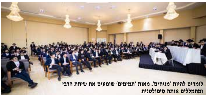
לומדים להיות 'מניחים'. מאות 'תמימים' שומעים את שיחת הרבי וממתלים אותה סימולטנית

במסגרת זאת, הופיעו עד כה תשעה גיליונות הנושאים את השם 'הוא בחיים'. זהו עלון שכל מטרתו היא לעודד את הכתיבה לרבי ואת הנסיעה לרבי. "לפרויקט הזה יצאנו לדרך מבלי שעמד לצדנו גביר שפרש חסות על העלויות האדירות הכרוכות בהדפסה ובהפצה של זה. אבל זה מהר מאוד הפך לעובדה