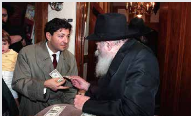
jem | ID 61787

צעד כזה מבלי לקבל את האישור מניו-יורק. למחרת הגיעה תשובה: הרבי הורה שהשניים יסעו מיד.