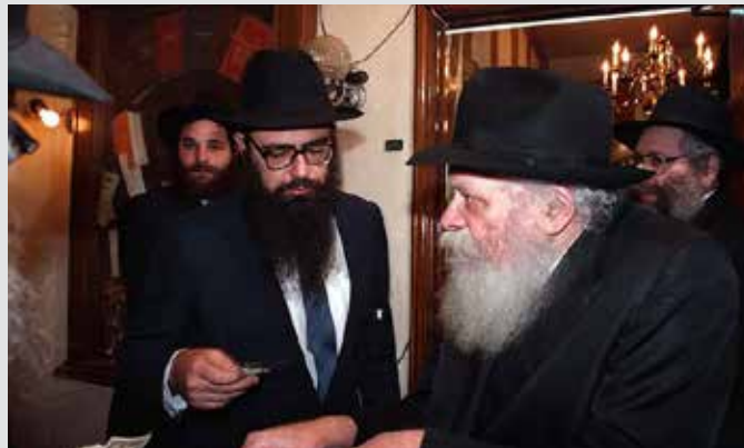
jem | ID 66046

כיוון שגדול אדוננו, ויש מוסדות רבים ושלוחים רבים