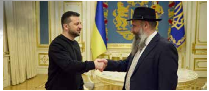
י"ר הפדרציה השליח הרב מאיר סטמבלר עם ידידו נשיא אוקראינה זלנסקי

הפסח. הפדרציה שיגרה מצות בכמויות עצומות וסיפקה לכל שליח את כל הדרוש לו לטובת הסדרים הציבוריים ההמוניים הנערכים ברוב פאר והדר ובהשתתפות שיא של יהודי המקום. כאמור, היו אלו לא רק שלוחי הקבע אלא גם הבחורים הפוקדים את הערים הקטנות בחגים ומפיחים בהם רוח של יהדות חסידיית תוססת."