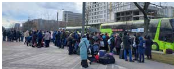
עוד שיירת חילוץ עושה את דרכה מן התופת. סה"כ חילצה הפדרציה בשת"פ עם השלוחים 34,000 יהודים מאוקראינה