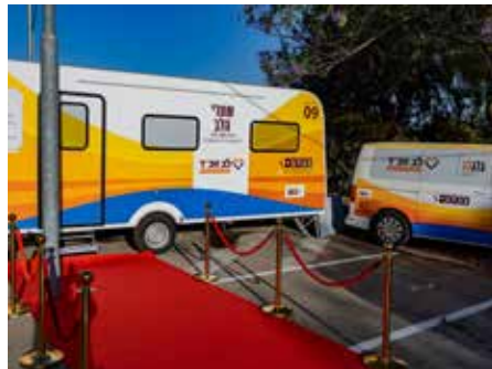
אחת מיחידות האירוח הניידות - בבית הרפואה 'קפלן' ברחובות

סעודות השבת, עם כל האווירה המיוחדת שאתה ובני ביתך משרים בה".