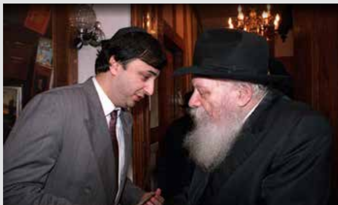
jem | ID 94797

את הדוגמה המובהקת ביותר לכך קיבלנו מהרבי. הרבי נהג לעודד כל ילד לתת צדקה כשהיה מעניק לילדים מטבעות לשים