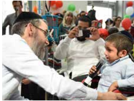
גדול הזמר החסידי ר' אברהם פריד בהתנדבות באירוע ילדים של לב חב"ד

"אינספור יהודים שהיו בגדה קרקפתא דלא מנח תפילין, התצטרו בתפילין לראשונה בחייהם. זה קורה דווקא בבתי רפואה כי הנסיבות של השקות שם פותחות את הלב וגורמות להתעוררות"