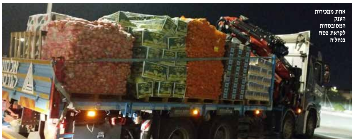
אחת ממכירות הענק המסובסדות לקראת פסח בנחל'ה