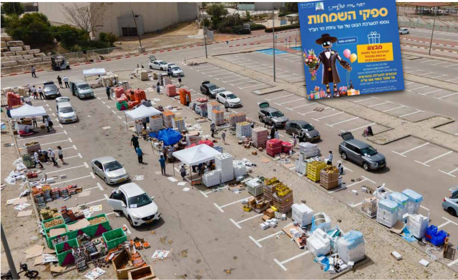
דאגה לכל התושבים. ארגוני ענק של פירות וירקות שנמכרו בנחלה ביזמת הועד במחיר מזול במיוחד לקראת חג הפסח האחרון