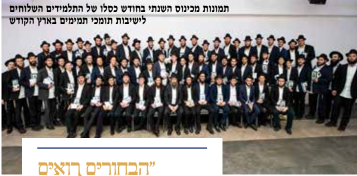
תמונות מכינוס השנתי בחודש כסלו של התלמידים השלוחים לשיבות תומכי תמימים בארץ הקודש