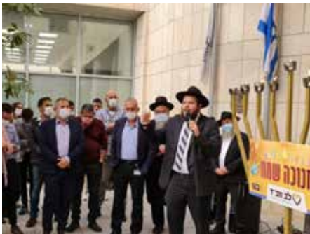
הדלקת נרות חנוכה במטה הארצי של משרד הבריאות עם שר הבריאות דאז מר ניצן הורביץ