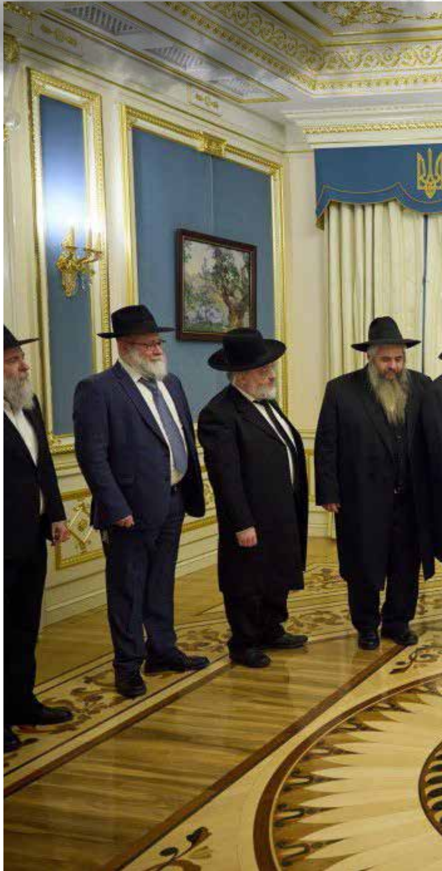
השלוחים באוקראינה נפגשים עם נשיא אוקראינה זלנסקי במפגש שיזמה הפדרציה

מה צושה יהודי שמצודו לא צרך טקס יהודי כלשהו בביתו כשמתברר לו כי השנה יאלץ לערוך את סדר הפסח בביתו • כיצד יצרה הקורונה מאגר בלתי נדלה של עשרות אלפי כתובות של בתי משפחות יהודיות • איך משנעים מזון ומוצרי יודאיקה חיוניים ליהודים שנצורים בבתיים או שנמלטו מהם לאחר שהפכו לעיי חרבות, לא לפני שצבא רוסיה ירה לעברם טילים קטלניים • השליח הרב מאיר סטמבלר, הצומד בראש הפדרציה היהודית באוקראינה, מספק תשובות לשאלות המסקרנות