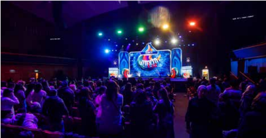
כנס כ"ב שבט המרכזי לעילוי נשמת הרבנית נ"ע שנערך כמדי שנה בבניי האומה בירושלים

האישית שלה ומקבלות בית עם מעטפת של לימודי קדש וחסידות ותנאי אש"ל ברמה גבוהה, ומצטיידות בכלים שאיתם תבנינה את בתיהן. המתכונת של דוברות רוסית זהה לחלוטין אם כי בשפה שונה ובניואנסים אחרים.