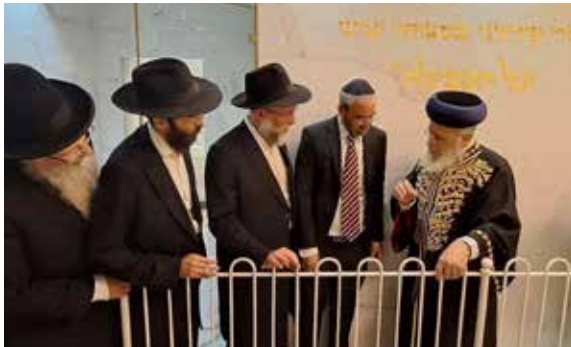
חנוכת מקוה חב"ד נוף כנרת בצפת בהשתתפות הראש"צ הרב יצחק יוסף ורב העיר הרב שמואל אליהו והרב ביסטרצקי

התוצאה מדברת בעד עצמה והיא מפעימה בכל קנה מידה: לא פחות ממאה מקוואות טהרה חדשים, מהודרים ומשוכללים הוקמו מחדש מן המסד ועד הטפחות, כשעל הקמתם מפקח הלכתית מרכז מקוואות חב"ד. המרכז נכנס לתוך הקרביים של כל אחד מהמקוואות, ובחלקם אף מגייס משאבים, עומד על קוצו של יו"ד בכל פרט בהקמה ומלווה את התהליך כולו עד שזוכים לברך על המוגמה. וגם אז, לא נח ולא שקט אלא ממשיך לבדוק, לעקוב ולוודא שהטהרה תהיה מושלמת, משוכללת ומפוארת, לטובת הדורות הבאים לעולמנו כתוצאה ישירה של מפעל טהרה זה.