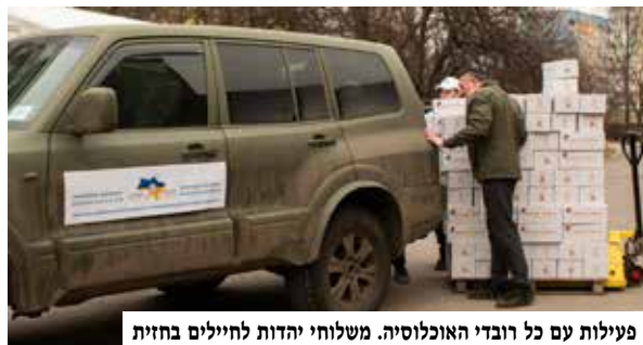
פעילות עם כל רובדי האוכלוסיה. משלוחי יהדות לחיילים בחזית