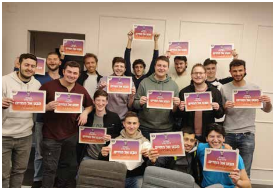
קבוצת אחת מתוך ארבעים קבוצות של סטודנטים מסיימי קורס "מבט אל החיים" שסיימו לפני שבועיים

ובשש וחצי לפנות בוקר, כשנורו הטילים הראשונים מעזה ובחסותם פרצו המחבלים לתוך הבסיס, הצטמררתי לנוכח המוחשיות המבהילה שקיבלו דבריי. לנגד עיניי, לנגד עיני רעייתי שנפצעה ולנגד עיניהם הלומות הרעם של שמונת ילדיי, שלושה עשר חיילים מסרו נפשם ועוד רבים נפצעו – עד שהצליחו להשתלט על המחבלים הארורים שפשטו על הבסיס ולנטרלם. או אז אכן נודע הדבר."