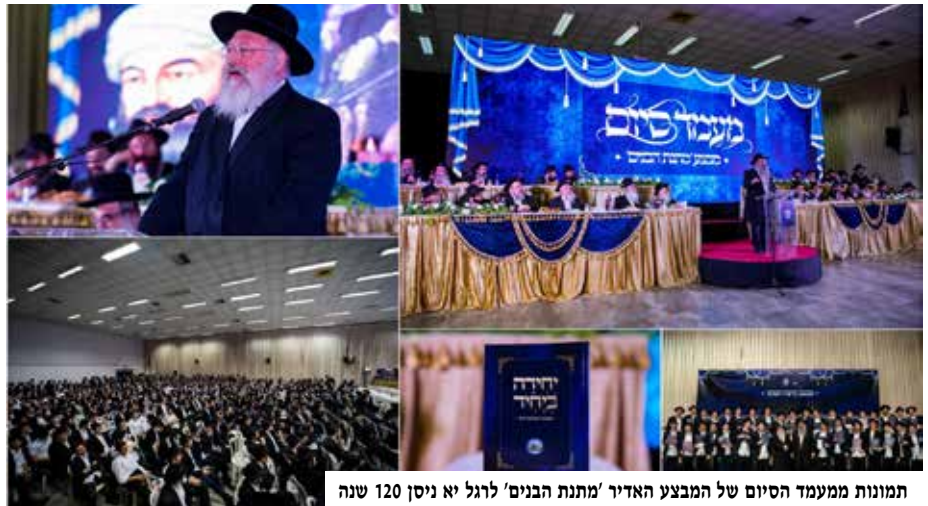
תמונות ממעמד הסיום של המבצע האדיר 'מתנת הבנים' לרגל יא ניסן 120 שנה

לקראת ג' תמוז השתא, הכריז ועד התמימים על מבצע מיוחד בכל הישיבות. המבצע נארג והוכן יחד עם התלמידים השלוחים בישיבות ובמסגרתו נדרשו התמימים ללימוד שווה לכל נפש – טעימה מתורת הרבי מתוך קובץ מיוחד שהכיל: שני מאמרים, שתי רשימות, שתי שיחות ושני מכתבים כלליים שהמכנה המשותף שלהם התמקד בענייני התקשרות, גאולה ומשיח. המבצע כלל פרסים מיוחדים שגם הם עצמם אינם אלא חיזוק ההתקשרות: הגרלות על דולר של הרבי, כתי"ק של הרבי ועוד.