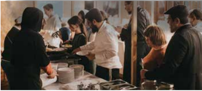
הלב הפועם של הפליטים. מחזה שגרתי במחנה הפליטים של הפדרציה והשלוחים, בבלטון שבהונגריה שעדיין פועל יום יום