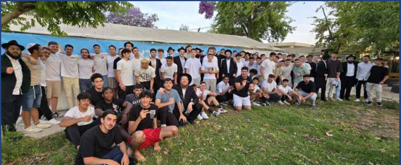
נערי חב"ד לנוער בשבת כפר חב"ד